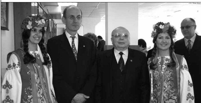
Встреча иностранных делегаций

И, наконец, материально-техническая база. Кто бывал в нашем университете, видел хорошо отремонтированные аудитории, современную мебель, высокий уровень компьютеризации. У нас отличные условия для занятия спортом, в распоряжении наших студентов современный спорткомплекс и два прекрасных спортивных зала. Сегодня у нас на балансе 7 общежитий. Каждый год мы вкладываем более 5 миллионов гривен только в их капитальный ремонт. Многие из наших общежитий имеют не только достойные условия быта, но и все необходимое для успешной учебы: читальные залы, доступ в сеть интернет и многое другое. Кроме этого, мы постоянно пополняем библиотечные фонды и компьютеризируем учебный процесс - аудитории, библиотеку, структурные подразделения.