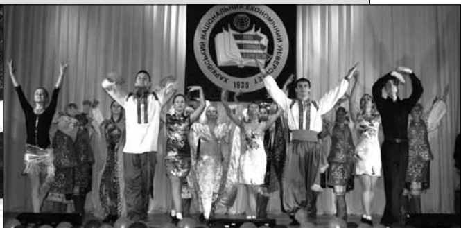
Посвящение в студенты (2009 год)